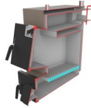
Котел Bizon M Термо (сталь 5мм)

Сталь 09Г2С. Комплектація: термометр, чавунні колосники, зольний ящик, комплект для чистки котла (основні згони 10-18кВт - ДУ40; 20кВт - ДУ50)