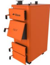
Котел Bizon GK-P (Сталь 6мм, Термо)

Сталь 09Г2С. Комплектація: автоматика, електронний термометр, комплект для чистки котла, водяні колосники (основні згони 50-65кВт - ДУ50, 75-90кВт - Фл.65, 100-150кВт - Фл.80)