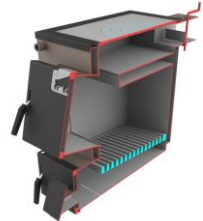
Котел Bizon M-П Термо (із плитою, сталь 5мм)

Сталь 09Г2С. Комплектація: термометр, чавунні колосники, зольний ящик, комплект для чистки котла (основні згони 10-18кВт - ДУ40; 20кВт - ДУ50)