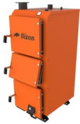
Котел Bizon KBATPO (Сталь 6мм, Термо)

Сталь 09Г2С. Комплектація: електронний термометр, колосники водяні або чавунні на вибір до 50кВт, комплект для чистки котлів, (основні згони 15-65кВт - ДУ50, 80-99кВт - Фл.65, 120-150кВт - Фл.80, 200кВт - Фл.100)