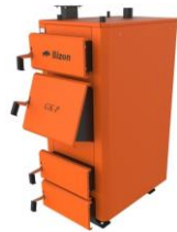
Котел Bizon GK-P (Сталь 6мм, Термо)

Сталь 09Г2С. Комплектація: електронний термометр, комплект для чистки котла, колосники водяні або чавунні на вибір до 50кВт (основні згони 10-44кВт - ДУ50)