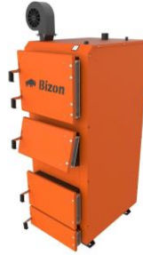
Котел Bizon KBATPO (Сталь 6мм, Термо)

Сталь 09Г2С. Комплектація: електронний термометр, колосники водяні, комплект для чистки котлів, (основні згони 15-65кВт - ДУ50, 80-99кВт - Фл.65, 120-150кВт - Фл.80, 200кВт - Фл.100)