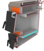
Котел Bizon M-П (із плитою, сталь 5мм)

Сталь 09Г2С. Комплектація: термометр, чавунні колосники, зольний ящик, комплект для чистки котла (основні згони 10-18кВт - ДУ40; 20кВт - ДУ50)