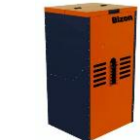
Бункер під пелети