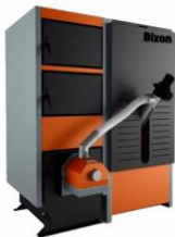
Котел Bizon Pellet-P (Сталь 5мм, Термо з бункером 400л)

Сталь 09Г2С. Комплектація: електронний термометр, зольний ящик, комплект для чистки котла, без колосників, палиник, турболізатор, (основні згони 15-30кВт - ДУ40, 40-50кВт - ДУ50)